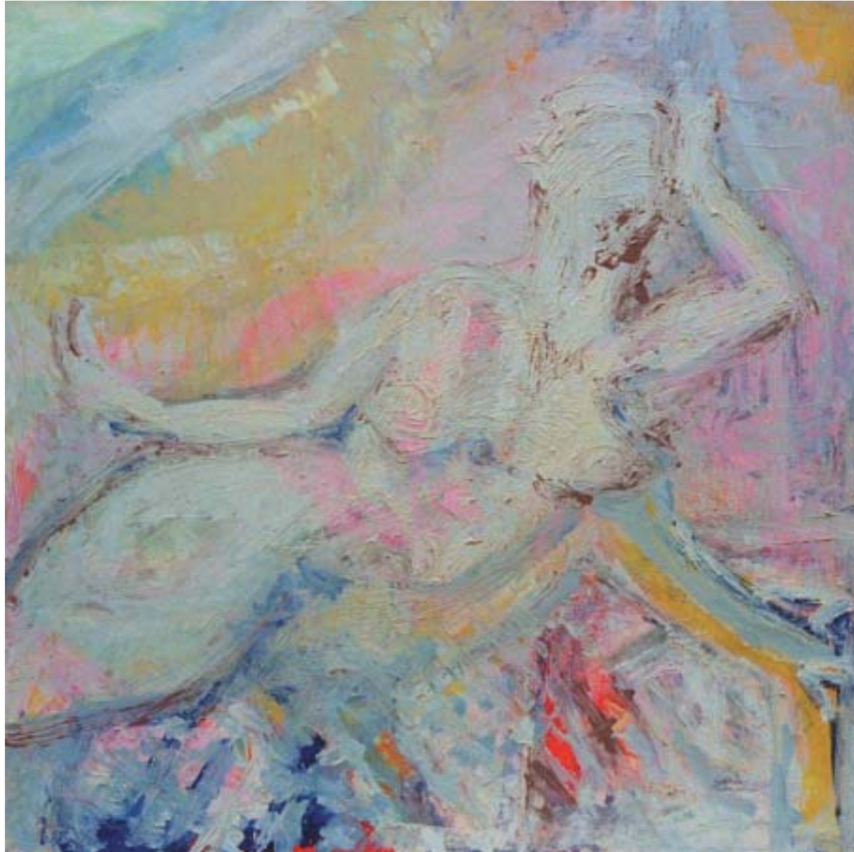
St. Anna "Figur aus Stuckornament mit gemustertem Feld" Öl /Lw 120 x 120 cm