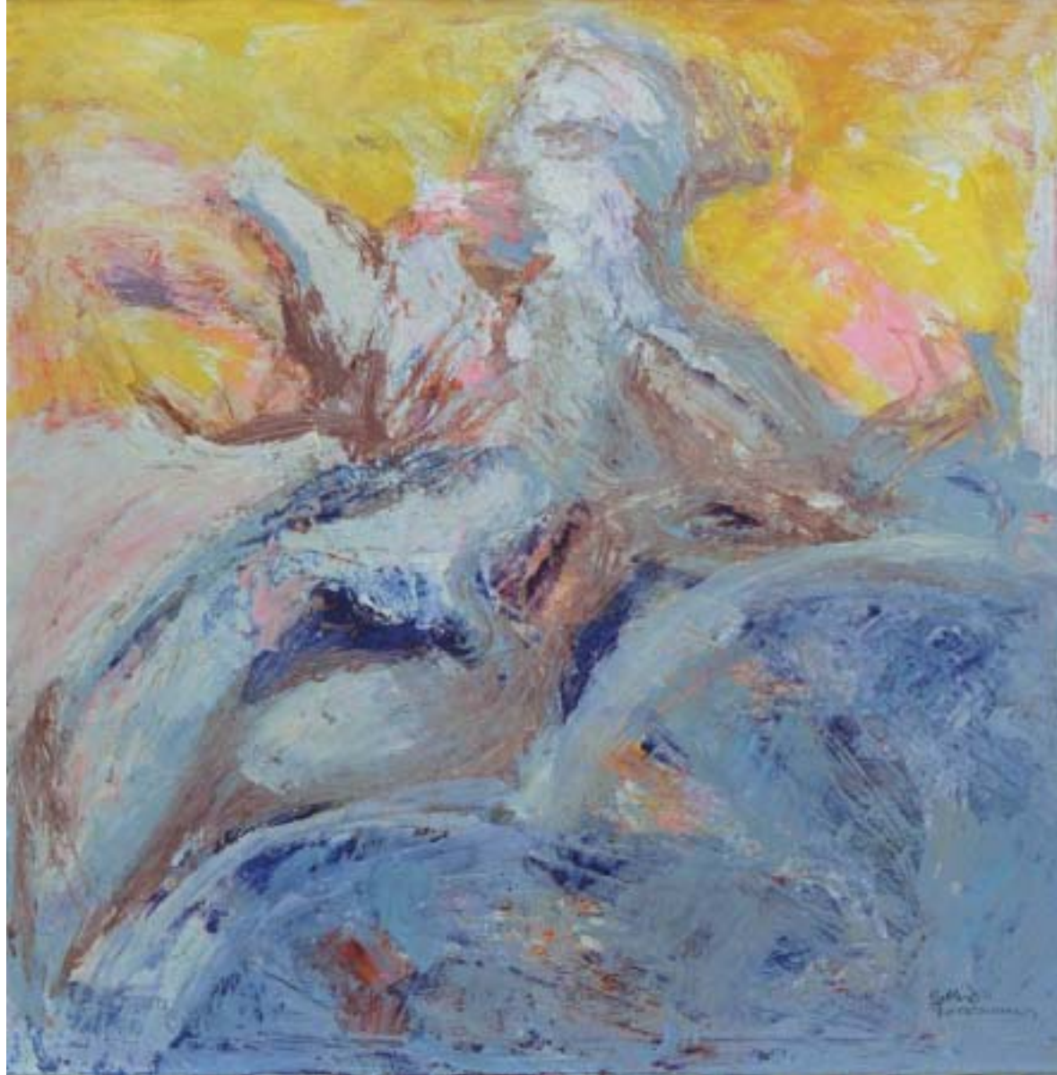
St. Anna "Figur aus Stuckornament mit blauem Feld" Öl /Lw 120 x 120 cm