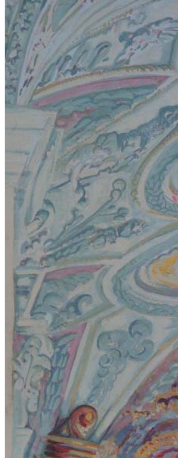
St. Anna "Innenansicht" (Ausschnitt) Öl /Lw 120 x 70 cm

Die Formensprache der Ornamente führt dann zu einer malerischen Umsetzung in rhythmische Strukturen und körperliche Formen.