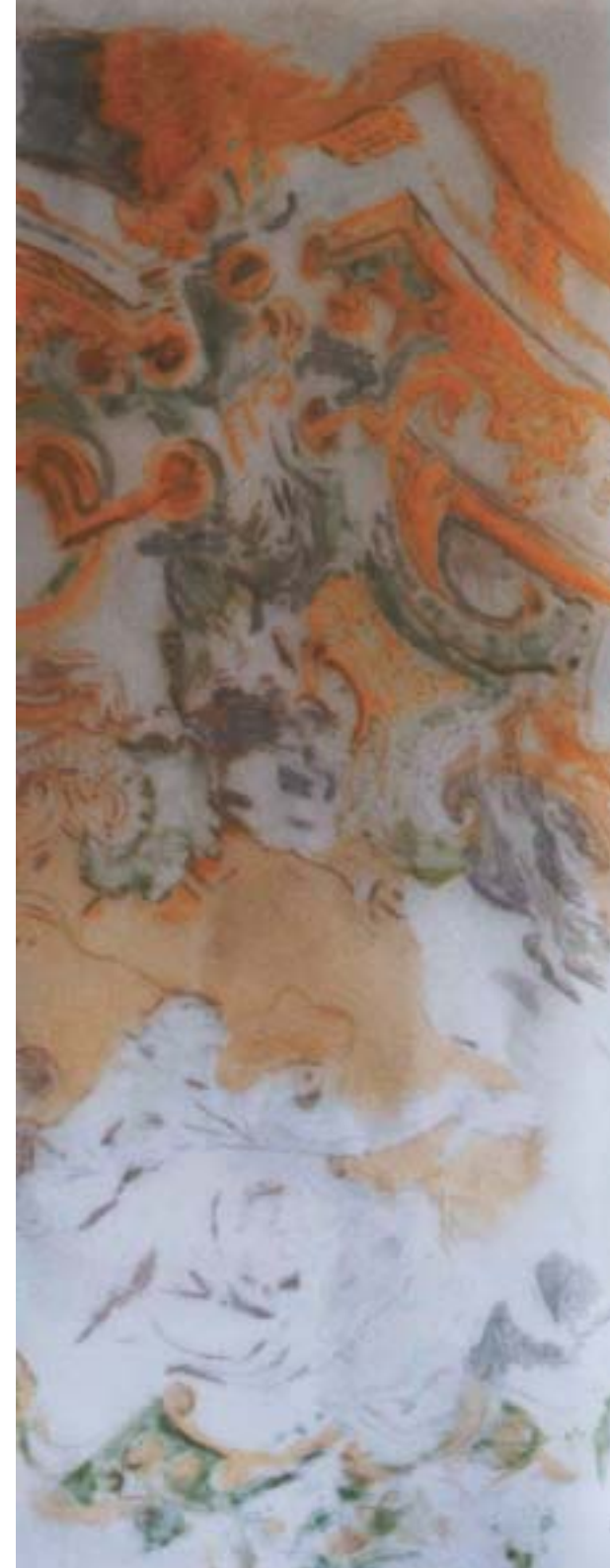
St. Ulrich "...ein Stück Maßhalten..." Öl, Bleistift/ Transparentpapier 180 x 60 cm